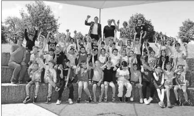
Hurra: Geschenke für die Grundschüler

Als Geschenk gab es ganz klassisch ein Sparschwein – mit Schlüsselchen wohlgekernt, sodass das Schwein bei Gelegenheit auch selbst geschlachtet werden kann.