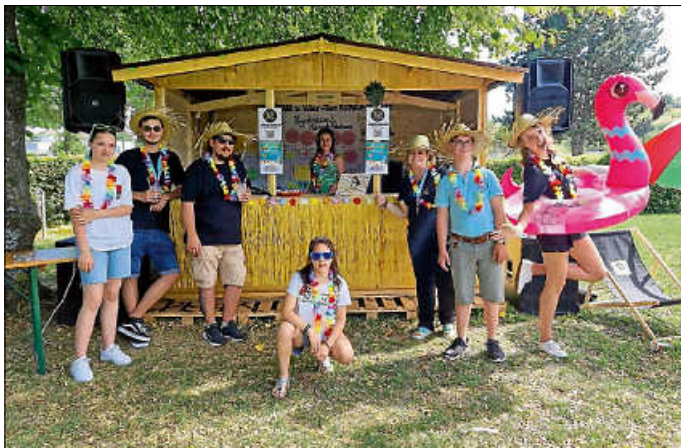
Wir freuen uns auf euch, kommt vorbei und chillt mit uns in unserer Beachbar.

Auch dieses Jahr dürfen wir während des Irma West Kinder- und Heimatfests eine chillige Beachbar bei der neueingeweihten Jugendeventwiese am Skatepark anbieten. Die JUZ-Beachbar findet von Freitag, 12. bis Sonntag, 14. Juli statt und öffnet für euch von 14.00 Uhr bis 22.00 Uhr. Unsere Jugendprojektgruppe vom JUZ Hechingen verkauft an dem Beachbar-Container alkoholfreie Cocktails und Slusheis gibt es von Ben und Ali von Downtown aus der JUZ-Hütte. Die JUZ-DJs machen auf der neuen Jugend-Bühne Musik. Auf unseren selbstaufgebauten Beachstühlen könnt ihr unter ein paar Sonnenschirmen chillen.