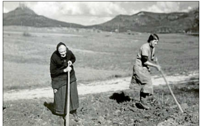
Harte Arbeit, karger Lohn: Landwirtschaft im Albvorland