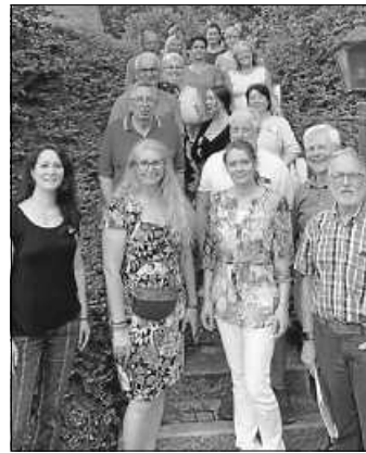
Teilnehmer Basisseminar 2024.