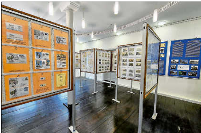
Briefmarken und Münzen aus den Partnerstädten

Der zweite Programmteil des Samstags fand im Hohenzollerischen Landesmuseum statt. Zu sehen sind dort bis zum 19. Juli Briefmarkensammlungen, die von den Philatelisten aus Hechingen und Hódmezővásárhely zusammengestellt wurden. Ausgestellt wird auch eine Sammlung historischer Münzen aus der Geschichte Hohenzollerns und Ungarns.