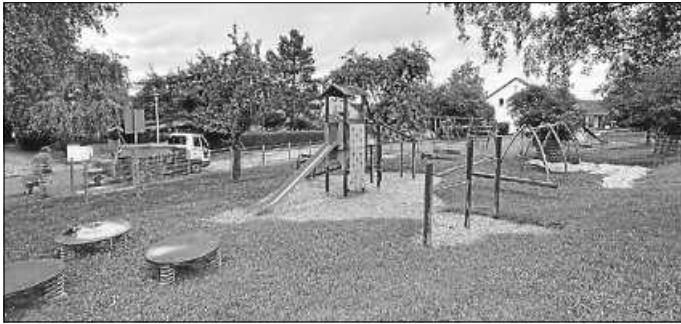
In schwerer Handarbeit werden die Hackschnitzel eingebracht.

Betriebshofmitarbeiter haben in der vergangenen Woche die Spielbereiche mit neuen Hackschnitzeln befüllt. Herzlichen Dank dafür.