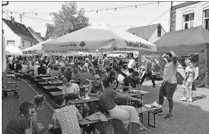
Boll ist toll!

Die ausrichtenden Vereine freuen sich auf viele Besucher, Spaß und Unterhaltung.