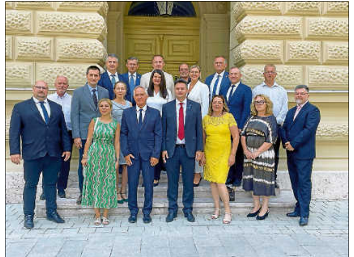
Vertreter der Stadt Hódmezővásárhely und aus deren Partnerstädten.

Das Weinfest findet alljährlich im Rahmen der Feierlichkeiten zum St.-Stephans-Tag statt. Dieser wird am 20. August gefeiert und erinnert an die Gründung der ungarischen Nation und die Christianisierung der Magyaren im Jahre 1000 n.Chr. durch König Stephan I., der später heiliggesprochen wurde. Traditionell wird an diesem Tag neues Brot gebacken, das Reichtum und Fruchtbarkeit des Landes symbolisieren soll.