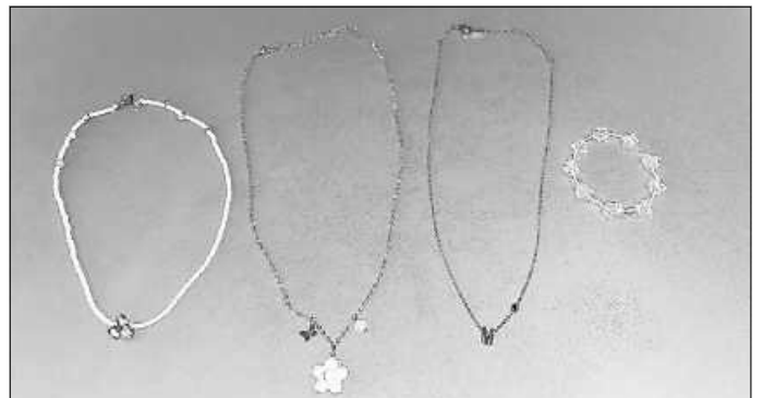
3 Halsketten und ein Armkettchen.

In der Turnhalle sind mehrere Schmuckstücke liegen geblieben. Die Eigentümer können die Fundsachen zu den Öffnungszeiten bei der Ortschaftsverwaltung abholen.