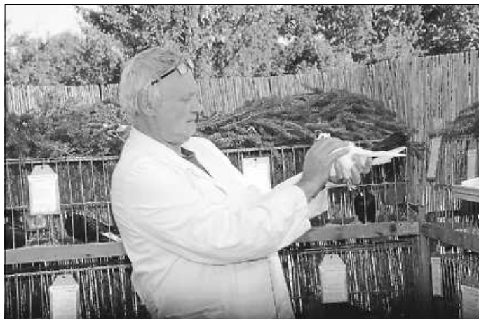
Die Tiere werden von den Richtern genau in Augenschein genommen.

Am Sonntagmorgen gibt es einen Frühschoppen. Für die Verköstigung ist sowohl am Samstagabend als auch am Sonntagmittag und zur Kaffeezeit ausreichend gesorgt. Gegen 14.00 Uhr am Sonntag findet die Siegerehrung statt. Wir laden alle recht herzlich ein, egal ob Mitglieder oder Besucher zur Jungtier- und Freilandschau. Zum Aufbau der Käfige treffen sich die Mitglieder am 3. September, 18.00 Uhr, am alten Schafstall.