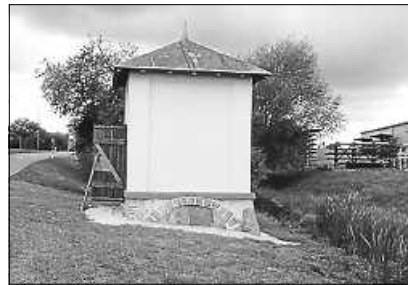
Das Sickingener Schwefelhäuschen zwischen Sickingen und Bodelshausen.

Am Sonntag, 8. September, gibt es wieder die Möglichkeit von 14.00 bis 16.00 Uhr, Wissenswertes über das Sickingener Schwefelhäuschen zu erfahren. Weitere Informationen folgen.