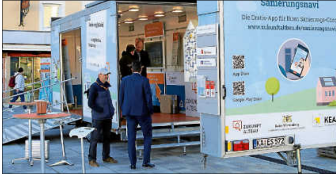
Infos zu Altbausanierung, Energie und Klima gibt es am kommenden Dienstag auf dem Obertorplatz.