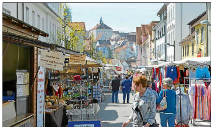
Am Donnerstag ist Michaelimarkt.

Der Hechinger Michaeli-Krämermarkt findet am Donnerstag, 26. September, in der Herrenackerstraße statt. Zahlreiche Händler werden typische Marktware – vom Hosenträger bis zum Allround-Küchenhelfer – anbieten, natürlich wird es auch eine Marktwurst geben. Geöffnet sind die Stände von 8.00 bis 18.00 Uhr.