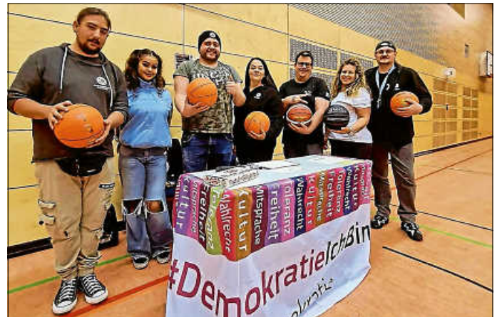
Ein Highlight war das Night Sport-Basketball-Event letzten Freitag in der Lichtenau-Halle von 18.30 Uhr bis Mitternacht.

Mit dem Albstädter Basketball-Verein On Fire BBC veranstaltete das gesamte ZU-Team ein offenes Basketball-Angebot mit DJ-Musik und Trainingseinheiten und einem kleinen Wettbewerb. Teilgenommen haben 25 Jugendliche – ein Erfolg für das erste Mal, findet das JUZ-Team. Ziel war, auf das schon bestehende offene Angebot, das immer freitags von 18.30 bis 20.30 Uhr in der Lichtenauhalle beim Gymnasium stattfindet, aufmerksam zu machen. Wir wollen den Jugendlichen außerhalb eines Vereins die Möglichkeit geben, diesen Sport auszuüben und zusammenzukommen. Außerdem findet auch immer dienstags ein Basketball-Angebot statt, von 17.30 bis 20.30 Uhr auf dem Roten Platz beim Gymnasium, welches eventuell in den Herbst- und Wintermonaten ebenfalls nach Innen in die Lichtenauhalle verlegt werden könnte. Daran arbeitet die Mobile Jugendarbeit des Jugendzentrums und wird Bescheid geben, sollte das dann der Fall sein.