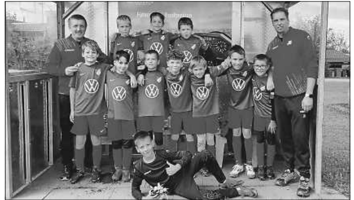
E-Jugend starte erfolgreich in die neue Saison.

Hast auch du Lust auf Fußball und bist im Jahrgang 2014 oder 2015? Dann komm zu den Trainingszeiten (montags und mittwochs von 17.30 - 19 Uhr) gerne auf dem Sportplatz in Stein vorbei. Die Coaches Jürgen und Eugen freuen sich auf dich.