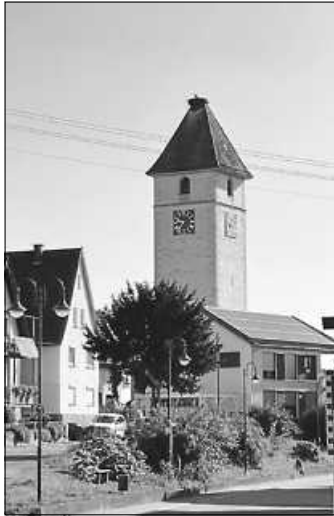
Biodiversität - moderne Tradition.