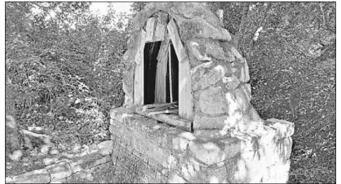
Die Mariengrotte, an der Fichtenwald-Tour, wächst.

Ein großer Teil der Mariengrotte, die Bestandteil der neuen Fichtenwald-Tour ist, wurde fertiggestellt. Der Rundbogen wurde mit viel Pusselarbeit und großer Geduld hergestellt, so wie auf dem Bild zu sehen ist. Der Beton muss noch ca. 2 Wochen aushärten. So lange muss die Schalung noch dran bleiben. Das Grobe ist gemacht. Sobald der Beton fest und ausgehärtet ist, können die Restarbeiten erledigt werden. Weitere Informationen folgen.