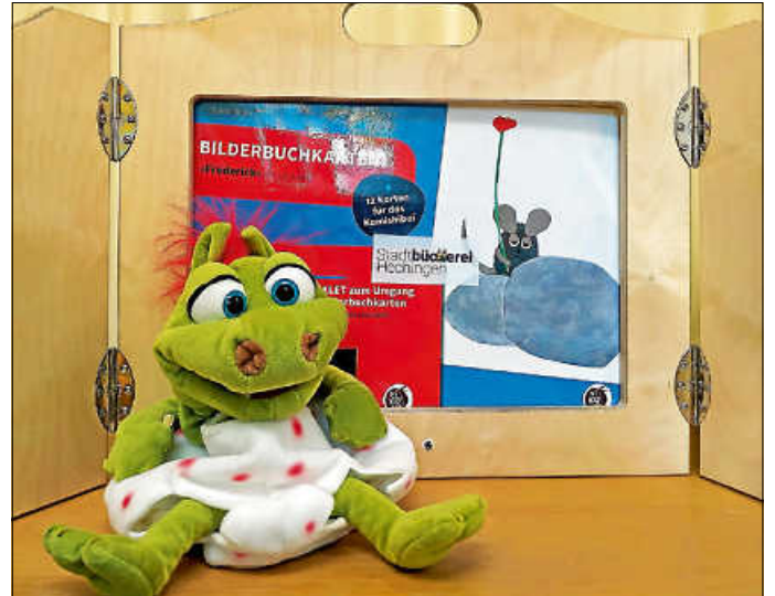
Das Bühnenbild für die Frederick-Lesung in der Stadtbücherei

Die Stadtbücherei bietet im Rahmen des Fredericktags mehrere Lesungen für Schulklassen an sowie zwei öffentliche Lesungen für Kinder im Vorschul- und im Grundschulalter. Die erste findet am Mittwoch, 23. Oktober, 16.00 Uhr in der Stadthalle Museum in Hechingen statt. Boris Pfeiffer, einer der Autoren der Kinderbuchreihe „Die drei ??? Kids“, ist der Einladung der Stadtbücherei Hechingen sowie des Sachgebiets Tourismus und Kultur der Stadt Hechingen gefolgt. Eintrittskarten sind nur an der Tageskasse erhältlich. Der Eintrittspreis für Erwachsene beträgt 8 Euro, für Kinder 6 Euro. Wer ein Buch von Boris Pfeiffer besitzt, kann es im Anschluss gerne signieren lassen.