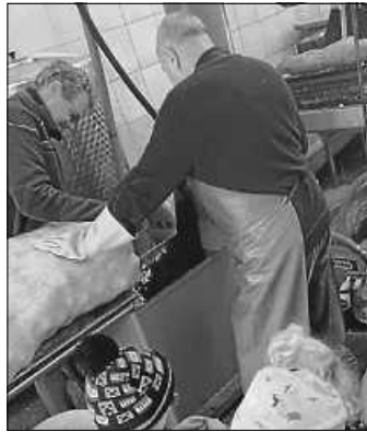
Besuch bei der Mosterei Beck.

Am Dienstag, 8. Oktober besuchte der Kindergarten St. Marien die Mosterei Beck in Weilheim. Die Kinder durften zusehen, wie die Äpfel maschinell gewaschen und zerkleinert wurden. Die Apfelstücke wurden in eine Form gefüllt und zu frischem Apfelsaft gepresst. Das Highlight war natürlich, als die Kinder diesen versuchen durften. Nochmal ein herzliches Dankeschön an die Mosterei Beck in Weilheim.