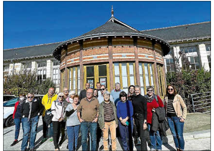
Herrlicher Sonnenschein das ganze Wochenende

Nach der Arbeitssitzung und vor dem Konzert blieb am Samstagmittag dann noch Zeit für eine Stadtführung in Tours mit dem „Petit Train“. Das Wochenende mit vielen herzlichen und freundschaftlichen Begegnungen wird allen Beteiligten, sowohl auf deutscher wie auch französischer Seite in guter Erinnerung bleiben – vive l'amitié franco-allemande !