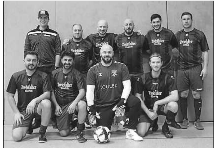
Unser AH-Team beim Sport-Mabitz-Cup.

Vergangenen Freitag war unsere AH beim stark besetzten Veteranenturnier des 1. FC Burladingen am Ball. Hier präsentierte sich unser Team souverän und konnte sich über einen überragenden zweiten Platz freuen. Während man die Vorrunde und das Halbfinale ohne eine einzige Niederlage absolvierte, musste man sich lediglich im Finale gegen die SGM FC Stetten-Salmendingen knapp mit 1:2 geschlagen geben. Wir gratulieren den Turniersiegern und bedanken uns bei den Gastgebern, wie auch allen teilnehmenden Teams fürs grandiose und top organisierte Turnier.