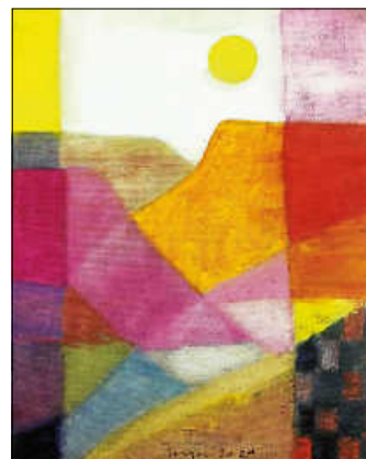
Bunt: Der Albtrauf.