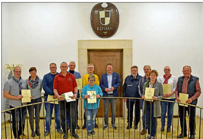
Blutspender sind Lebensretter!