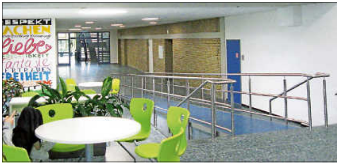
Der Flur im 2. Obergeschoss ist nicht nur sicherer, sondern auch schöner geworden.

Im Rahmen der Arbeiten wurde darüber hinaus ein kleines Mehrzweck-Klassenzimmer saniert. Dieses war noch auf dem Ausbaustand von 1974 und ist nunmehr runderneuert und mit entsprechend moderner Technik ausgerüstet.