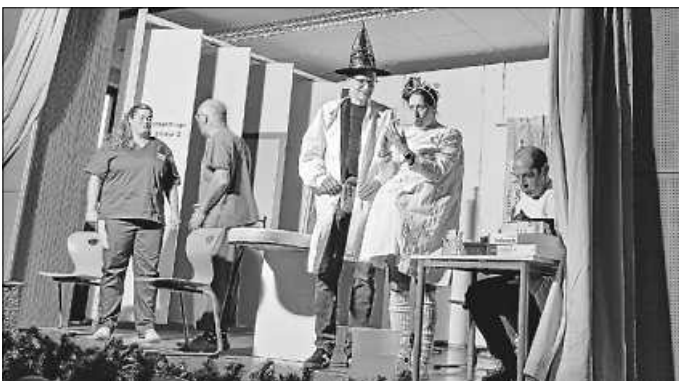
Der verrückte erste Tag in der Praxis Dr. Grünspan.