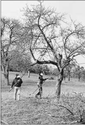
Ein Tag für Weilheim - Gemeinsam für unsere Obstwiesen.

In dieser letzten Schnittsaison der Förderungsperiode 21-25 sollten alle Bäume, die bisher nur einmal geschnitten wurden, ein zweites Mal schneiden.